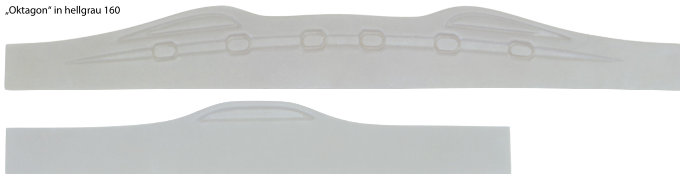
„Oktagon“ in hellgrau 160