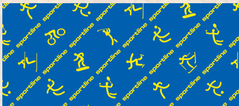
Sports line blau