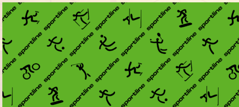
Sports line grün